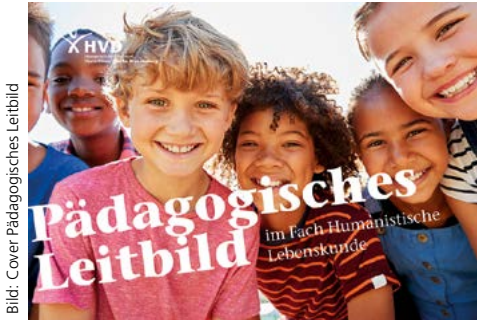
Bild: Cover Pädagogisches Leitbild

Humanistischer Lebenskundeunterricht ist lebendig und vielfältig, die ihn erteilenden Lehrkräfte gestalten ihn ganz unterschiedlich. Dennoch einen uns bestimmte pädagogische Grundsätze. Diese haben wir nun in einem Leitbild festgehalten, ebenso unsere Bildungsziele und deren pädagogische Umsetzung.